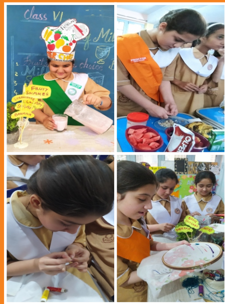
Domestic Art Activities