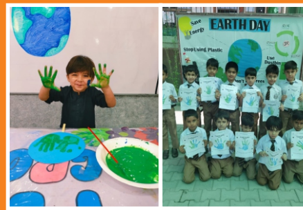
Earth Day Celebration