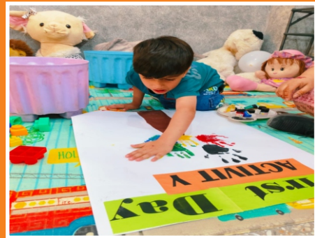
First Day at School