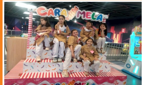
Students Day Out