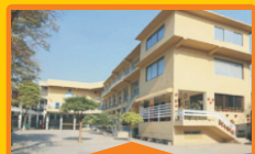
BOYS - I