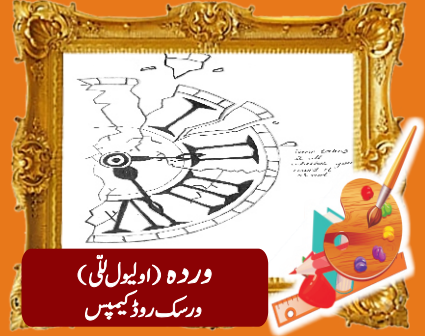
ورودہ (اوپیل ٹی) ورسک روڈ کیمپس