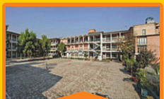
BOYS - II