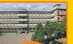
GIRLS - II