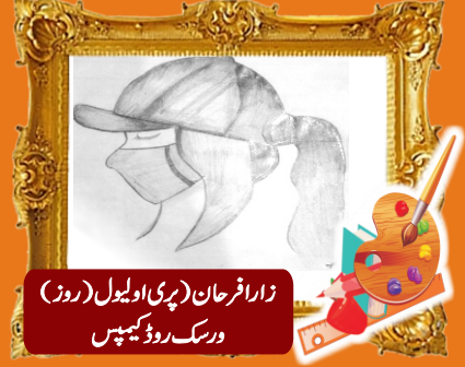
زارا فرحان (پری اوپیل - روز) ورسک روڈ کیمپس