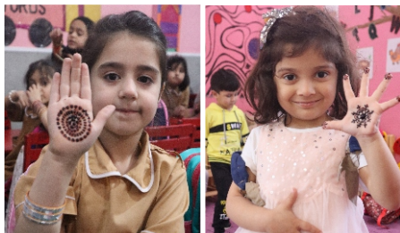
Eid Milan Party