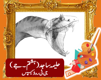
علیمہ ساجد (ہفتم - جے) جی ٹی روڈ کیمپس