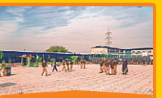
HAYATABAD BOYS CAMPUS