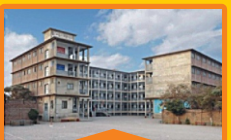
BOYS - V