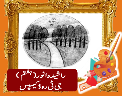
راشدہ انور (ہفتم - جے) جی ٹی روڈ کیمپس