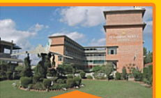
BOYS - IV