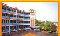
BOYS - III