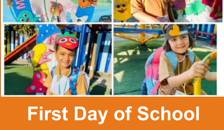
First Day of School