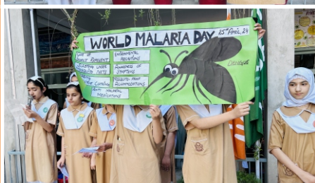
Observing Malaria Day