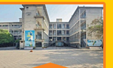
GIRLS - I