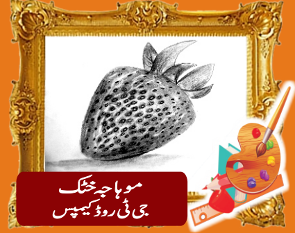
موبا چختک جی ٹی روڈ کیمپس