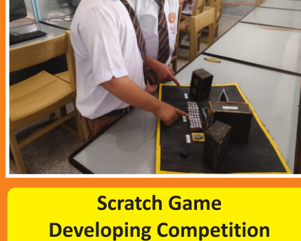
Domestic Art Activities