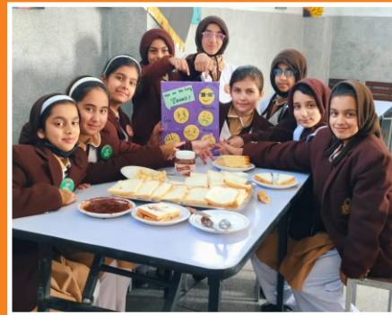
Sandwich Making Activity