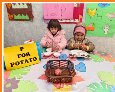
Alphabet Recognition Activity