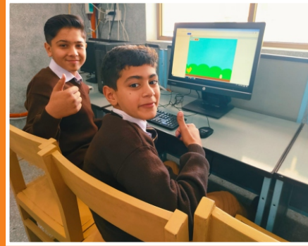
Scratch Game Developing Competition