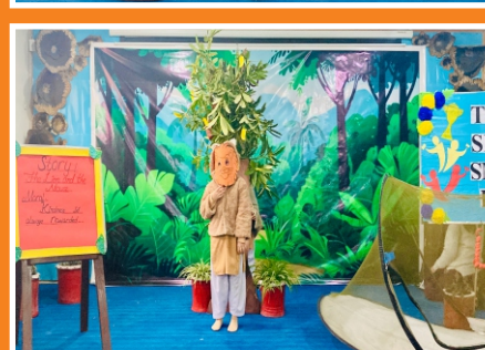
Story Telling Activity of Playgroup, Nursery and Prep